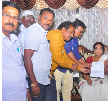
తెలంగాణ సాహితీ జూలై 19 ఖమ్మం జిల్లా జర్నలిస్టులకు// గతంలో ఉన్న రైల్వే రాయితీ సౌకర్యాన్ని

పునరుద్ధరించాలని డి యు డబ్ల్యూ జే ఐ జే యు అధ్యక్షులలో గురువారం కార్యసభ సభ్యులూ, కేంద్ర మాజీ మంత్రి రేణుకా చౌదరికి వినతి పత్రాన్ని అందజేశారు. కోవిడ్ కి ముందు దేశ వ్యాప్తంగా జర్నలిస్టుల కుటుంబ సభ్యులకు రైల్వే ఛార్జీలో 50 శాతం రాయితీ ఉండేదని, కోవిడ్